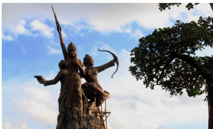
Gambar 2.1 Monumen Trijuang Jepara (Tugu Tiga Wanita)

Kabupaten Jepara merupakan wilayah kaya akan narasi historis dan kepahlawanan dalam historiografi nasional dengan ditandai peran sentral perempuan dalam lintasan kepemimpinan, mulai dari Ratu Shima pada abad ke-7 (Kerajaan Kalingga) yang dikenal dengan kepemimpinannya yang tegas dan berkeadilan, hingga Ratu Kalinyamat pada abad ke-16 yang dikenal atas kekuatan dan keahlian maritimnya terhadap kolonialisme, serta kelahiran pelopor emansipasi perempuan dan pendidikan pribumi, R.A. Kartini (Sartono, 2012; Susanti, 2018). Kekayaan narasi historis ini kemudian dikontekstualisasikan dalam ruang publik melalui peresmian Monumen Trijuang Jepara (Tugu Tiga Wanita) oleh Pemerintah Kabupaten Jepara pada 22 Desember 2016 (Medcom.id, 2016).