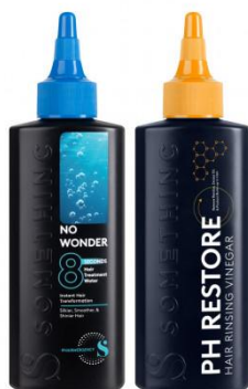
Gambar 2. 5 Produk Hair Care Somethinc

Somethinc memperluas inovasinya dengan menghadirkan rangkaian produk perawatan rambut atau hair care yang dibuat menggunakan bahan aktif berkualitas yang berfungsi untuk menutrisi akar rambut, memperkuat batang rambut, serta mengatasi berbagai permasalahan rambut seperti kerontokan, rambut kering, serta kerusakan rambut akibat penggunaan alat styling rambut serta produk pewarna rambut. Produk hair care Somethinc yaitu hair treatment water dan hair rinsing vinegar , produk hair care tersebut diformulasikan untuk menjaga kesehatan kulit kepala serta rambut.