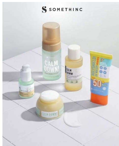
Gambar 2. 2 Produk Skincare Somethinc

Produk perawatan wajah atau skincare merupakan kategori produk utama dari Somethinc. Melalui berbagai inovasi yang dikembangkan, Somethinc menghadirkan rangkaian produk skincare yang berfungsi untuk membersihkan, menutrisi, serta melindungi kulit wajah dari berbagai permasalahan, produk skincare tersebut berupa cleansers, toner, serum, moisturizer, masker, lip treatment, eye treatment, dan sunscreen.