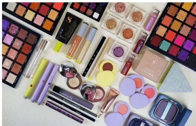
Gambar 2. 3 Produk Make up Somethinc

Somethinc memiliki produk kosmetik yang dikenal dengan konsep “ skincare infused makeup ”, yaitu produk kosmetik Somethinc bukan hanya produk kosmetik biasa tetapi didalam produk kosmetik ini mengandung bahan aktif perawatan kulit juga, konsep tersebut membuat konsumen tidak lagi khawatir akan kesehatan kulit mereka ketika sering menggunakan make up, karena kulit tetap ternutrisi dan tidak akan merusak kulit. Produk make up dari Somethinc memiliki banyak kategori mulai dari face, eyes, dan lips . Produk make up tersebut yaitu berupa cushion, powder foundation, tinted sunscreen, loose powder, eyebrow, mascara, eyeliner, highlighter, blush on, concealer, eyeshadow pallete, lip glaze, tinted lip balm, lip matte, dan water gloss . Selain itu produk kosmetik Somethinc memiliki banyak pilihan shade yang dapat disesuaikan dengan tipe dan warna kulit pribadi konsumen.