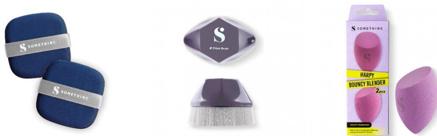
Gambar 2. 6 Produk Beauty Tools Somethinc

Beauty tools dari Somethinc didesain dengan material yang aman dan berkualitas, sehingga nyaman untuk digunakan di berbagai jenis kulit, termasuk kulit sensitif.