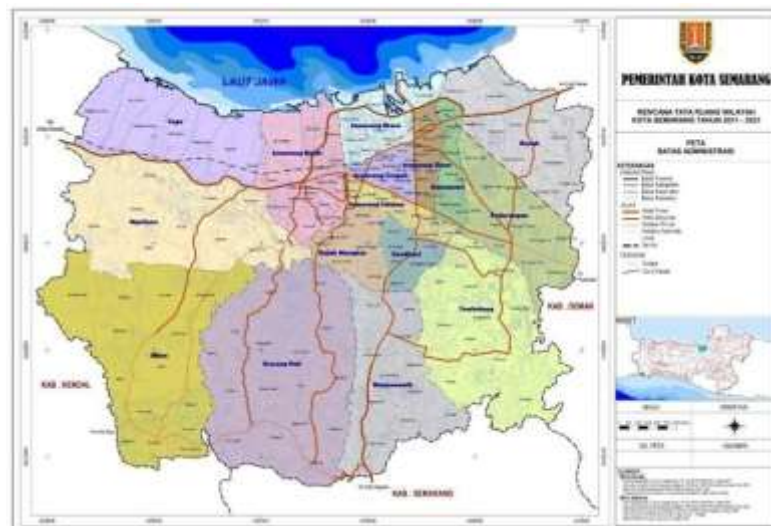
Gambar 2. 1 Peta Administrasi Kota Semarang