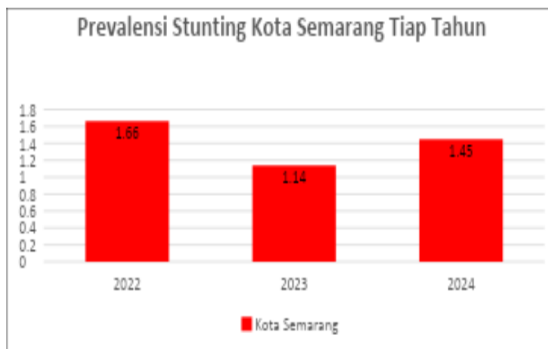
Gambar 1. 1 Angka Prevalensi Stunting di Kota Semarang tahun 2022-2024

Sumber: Portal satu data Indonesia tingkat Kota Semarang, 2024