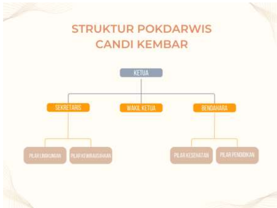
Tabel 2.5 Struktur Organisasi Pokdarwis Candi Kembar