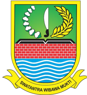
Gambar 2. 1 Lambang Daerah Kabupaten Bekasi

ditetapkan oleh Pemerintah Daerah. Salah satu jenis lambang daerah Adalah logo daerah, Adapun arti lambang dari Kabupaten Bekasi Adalah sebagai berikut.