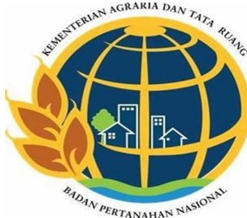
Gambar 2. 4 Lambang / Logo Badan Pertanahan Nasional