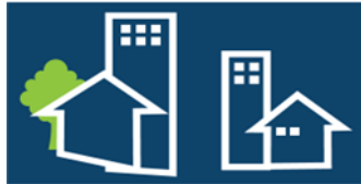
Gambar 2. 9 Bangunan Gedung dan Pohon

Gambar Bangunan Gedung dan Pohon memiliki arti sebagai simbol kekuatan, tekad yang bulat, sinergitas, dan keberlanjutan. Hal tersebut memaknai pelaksanaan secara konsisten dalam menyelesaikan, menangani dan mengutamakan hak serta menuntaskan kewajiban dengan penuh konsistensi, disiplin, dan tertib yang sesuai dengan kebijakan yang berlaku. Lambang Bangunan Gedung dan Pohon juga bermakna terhadap penggunaan dan pemanfaatan tanah yang selaras sesuai dengan Tata Ruang.