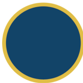
Gambar 2. 6 Lingkaran Bumi