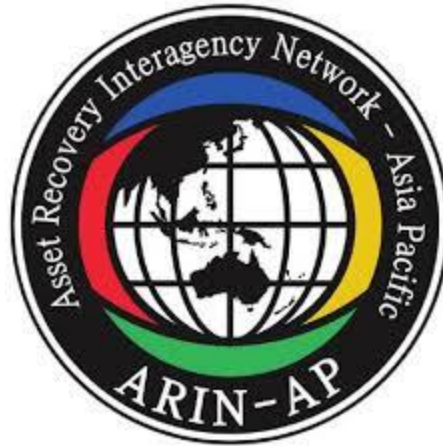
Gambar 2. 2 Logo ARIN-AP