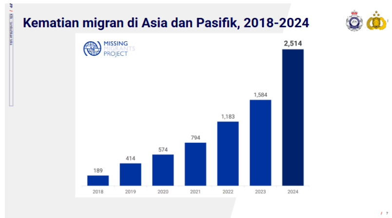
Gambar 1.2. Peningkatan angka kematian migran di Asia dan Pasifik

mendorong kedua negara ini meningkatkan kerja sama di bidang penanganan penyelundupan manusia. (Australian Federal Police, 2025)