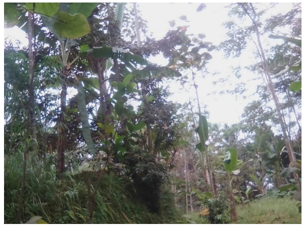
Ilustrasi 2. Gambaran Lahan di Desa Hutan

Pada Ilustrasi 2 menunjukkan berbagai tanaman yang tumbuh di ladang pertanian masyarakat. Tanaman yang mendominasi adalah tanaman tegakan atau kayu-kayuan.