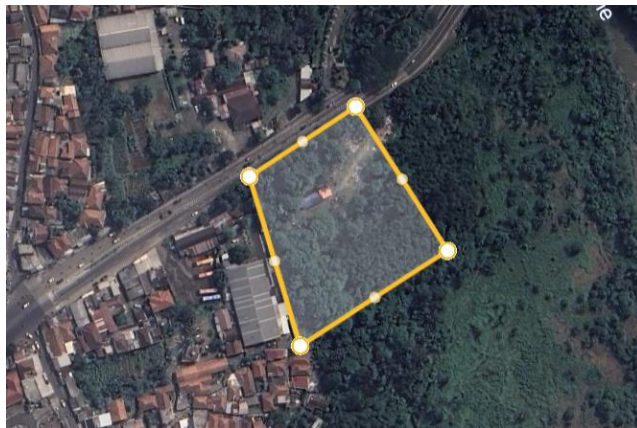
Gambar 3. 3 Alternatif Tapak 1

Terletak di Jalan KH. R. Abdullah Bin Nuh, Cibadak, Kecamatan Bogor Barat, Kota Bogor, Jawa Barat 16117.