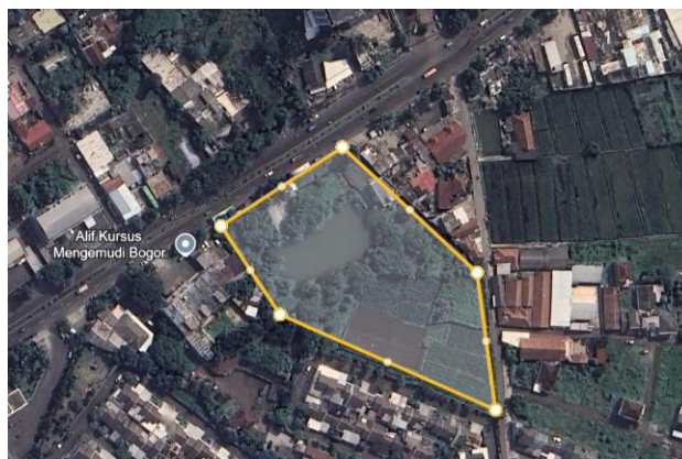
Gambar 3. 5 Alternatif Tapak 3