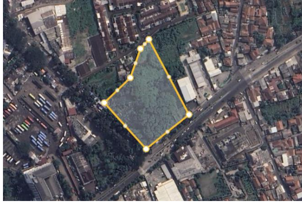
Gambar 3. 4 Alternatif Tapak 2

Terletak di Jalan Raya Cifor, Buladak, Kecamatan Bogor Barat, Kota Bogor, Jawa Barat 16115.