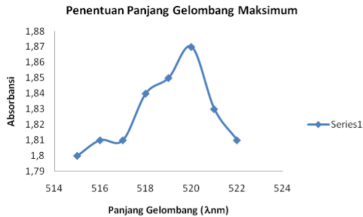
Gambar 1. Penentuan Panjang Gelombang Maksimum