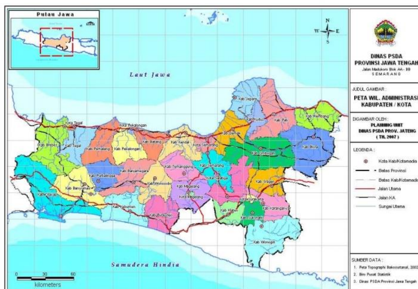
Gambar 2.1 Peta Administratif Provinsi Jawa Tengah