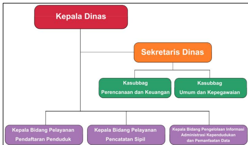
Gambar 2. 2 Struktur Organisasi