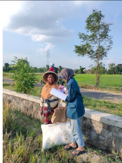
Wawancara Petani Perempuan