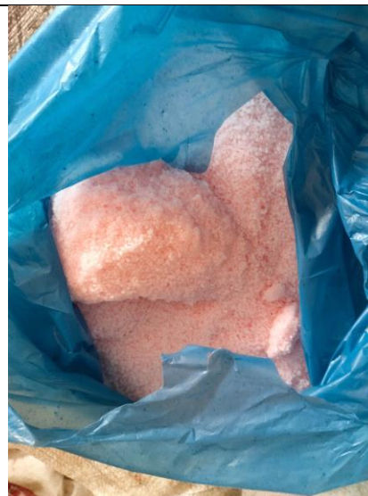
Pupuk Subsidi Urea