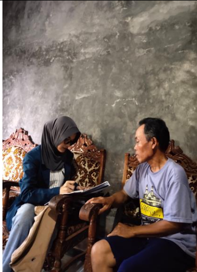
Wawancara Petani Laki-Laki