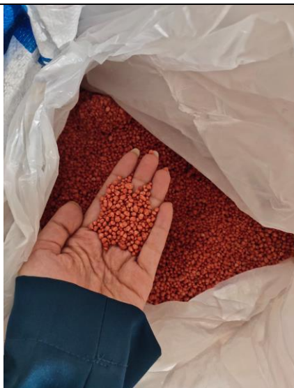
Pupuk Subsidi NPK