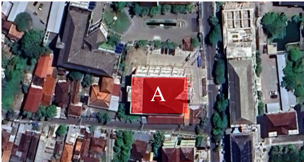
Gambar 1.2 Lokasi Gedung PKK Kabupaten Demak