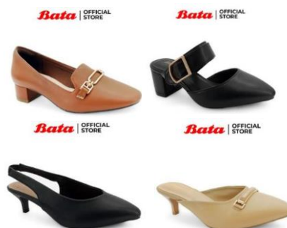
Gambar 2. 9 Produk Heels Bata

Produk alas kaki Bata juga menawarkan heels untuk wanita dengan bahan dan bantalan kaki yang empuk sehingga nyaman digunakan. Berdasarkan pada gambar 2.9 memiliki model desain yang beraneka ragam dan warna yang simple sehingga mudah dikombinasikan dan terlihat stylish . Produk heels ini memiliki sol yang kuat dan tahan lama penggunaannya.