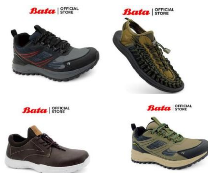
Gambar 2. 5 Produk Sepatu Sport Bata