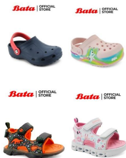
Gambar 2. 15 Sandal Anak Bata

Produk alas kaki Bata juga menyediakan sandal khusus untuk anak-anak seperti yang terlihat pada gambar 2.15 dimana sandal anak Bata ini memiliki beragam jenis model dan warna. Produk sandal anak ini juga dibuat dari bahan material yang berkualitas yaitu PU leather dimana bahan ini juga ringan. Sandal anak Bata ini juga memiliki sol dari bahan TPR yang kokoh sehingga sandal anak ini selain nyaman digunakan juga tahan lama.