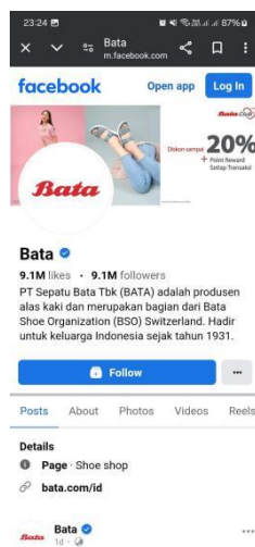
Gambar 2. 18 Facebook Bata