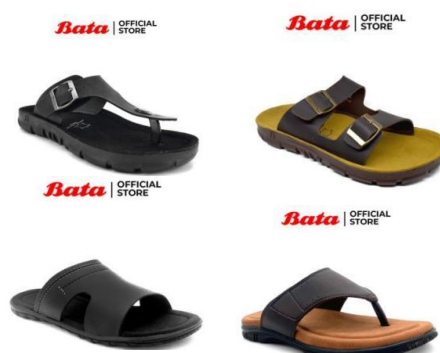
Gambar 2. 6 Produk Sandal Bata Pria

Produk alas kaki Bata juga menawarkan beragam jenis model sandal dengan beragam jenis material yang digunakan seperti yang terlihat pada gambar 2.6. Pada produk sandal Bata ini ada yang terbuat dari material tekstil, PU premium dengan insole kulit dan outsole karet. Selain itu, produk sandal ini juga memiliki outsole yang kokoh terbuat dari karet yang berkualitas sehingga anti slip. Sandal Bata ini juga nyaman digunakan, mudah dibersihkan, dan juga tahan lama sehingga cocok untuk aktivitas sehari-sehari.