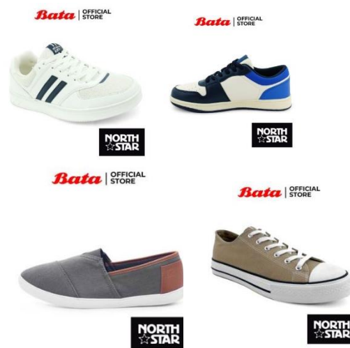
Gambar 2. 2 Produk Sneaker Bata Pria

Produk alas kaki Bata memproduksi sneakers seperti yang terlihat pada gambar 2.2, dimana terdapat beragam macam model sepatu sneakers yang ditawarkan. Produk sneakers yang diproduksi oleh Bata memiliki beragam jenis material, salah satunya terbuat dari material canvas dengan model desain yang trendi dan dinamis dengan mengikuti perkembangan mode fashion saat ini. Produk tersebut didesain dibuat dengan desain yang nyaman di kaki dengan sol yang kuat sehingga konsumen dapat tampil dengan tampil fashionable sekaligus nyaman digunakan untuk beraktivitas.