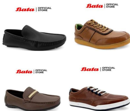
Gambar 2. 4 Produk Sepatu Casual

digunakan untuk beraktivitas. Alas kaki menawarkan tampilan dengan gaya tampilan yang smart casual .