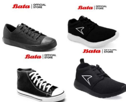
Gambar 2. 13 Produk Sepatu Sekolah Bata