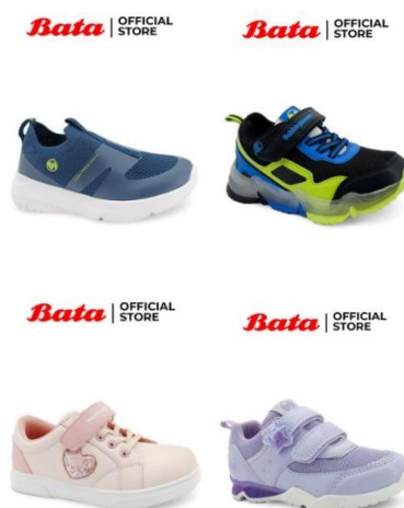
Gambar 2. 14 Sepatu Anak Bata

Pada sneakers Bata memiliki beragam jenis model dan warna. Produk sepatu anak ini terbuat dari material berbahan yang berkualitas tinggi seperti textile mesh dan PU leather yang nyaman. Produk ini juga dilengkapi dengan sol TPR yang kokoh sehingga tahan lama untuk digunakan dalam kegiatan aktivitas anak-anak.