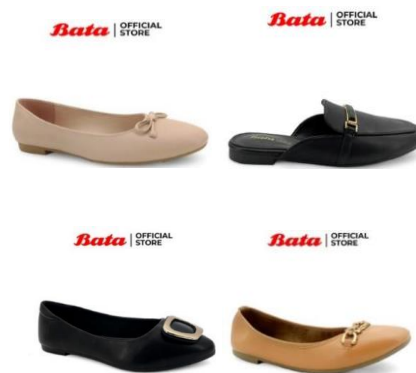
Gambar 2. 10 Produk Flatsshoes

Produk flatsshoes Bata tersedia dengan berbagai pilihan warna dan juga bentuk. Flatsshoes Bata terbuat dari bahan yang nyaman dan ringan sehingga dapat digunakan aktivitas seharian. Selain itu, produk alas kaki ini juga dapat digunakan untuk berbagai macam kegiatan acara karena dengan desain yang simple Namun tetap stylish .