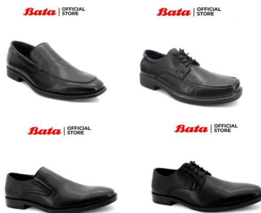
Gambar 2. 3 Produk Sepatu Formal Bata

Produk Bata juga memproduksi sepatu formal seperti yang terlihat pada gambar 2.3 dengan material yang berkualitas dan model desain yang trendi. Produk alas kaki ini dibuat dari material berbahan dasar PU dimana material ini mudah dicuci atau dibersihkan namun juga tahan lama. Produk alas kaki ini membuat penampilan konsumen menjadi semakin fashionable dan stylish yang nyaman untuk digunakan.