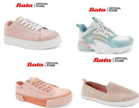
Gambar 2. 8 Produk Sneakers Bata Wanita

karena memiliki sol yang kuat dan juga bahan yang digunakan pun mudah untuk dibersihkan.