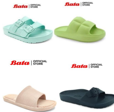
Gambar 2. 12 Produk Sandal Kasual Wanita Bata