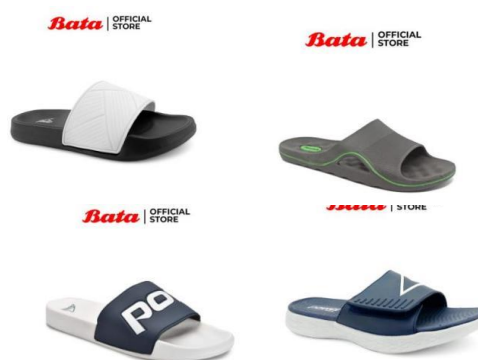
Gambar 2. 7 Sandal Kasual Bata Pria

Produk sandal kasual Bata itu sendiri memiliki model yang beraneka ragam model desain dan juga warna seperti yang ada pada gambar 2.7. Produk sandal kasual Bata ini terbuat dari bahan yang berbeda-beda di setiap jenis model desainnya, seperti material dari PU, eva, dan rubber upper . Selain itu, sandal kasual bata ini memiliki sol yang kuat sehingga tahan lama dalam penggunaannya. Tidak hanya tahan lama, sandal kasual ini juga mudah dibersihkan dan juga nyaman digunakan aktivitas sehari-hari.