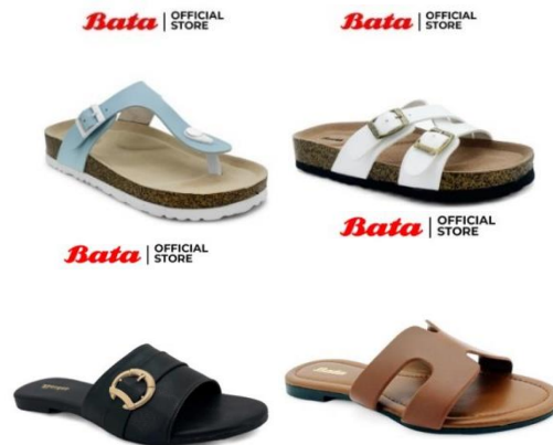
Gambar 2. 11 Produk Sandal Wanita Bata

dibersihkan. Selain itu, produk sandal Bata ini juga memiliki sol yang kuat sehingga tahan lama.