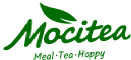
Gambar 2. 1 Logo Mocitea Tegalsari Sragen