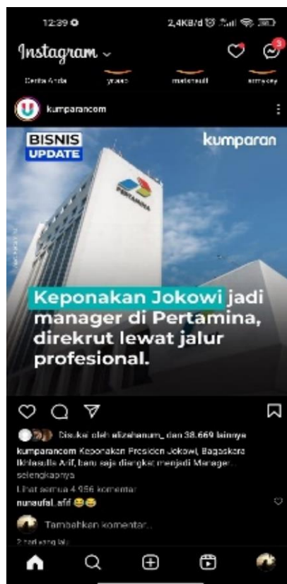
Gambar 2. 1 Tampilan Instagram

Kevin Systrom dan Mike Krieger meresmikan Instagram pada 6 Oktober 2010. Pada 2012, Instagram tersebut dibeli oleh Facebook. Instagram adalah salah satu media sosial yang dimanfaatkan untuk menyimpan dan membagikan momen ke dunia maya. Umumnya, Instagram fokus pada konten visual seperti foto dan video.