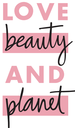
Gambar 2.1 Logo Love Beauty and Planet