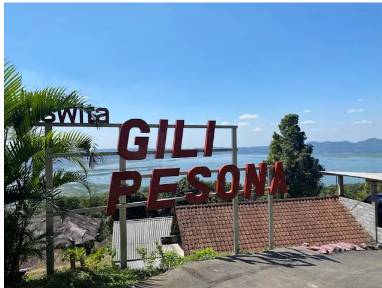
Gambar 2.4 Potensi Wilayah Atas Desa Kebondowo