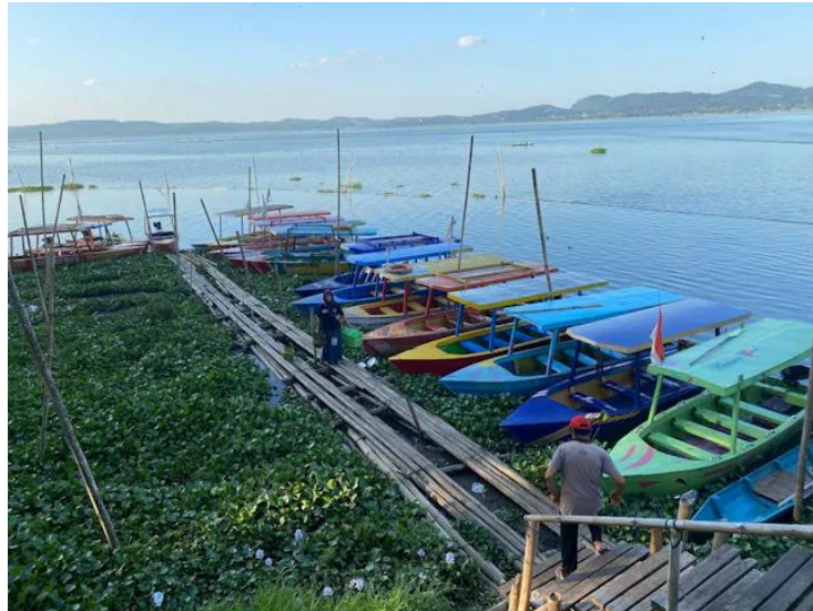
Gambar 2.3 Potensi Wilayah Bawah Desa Kebondowo