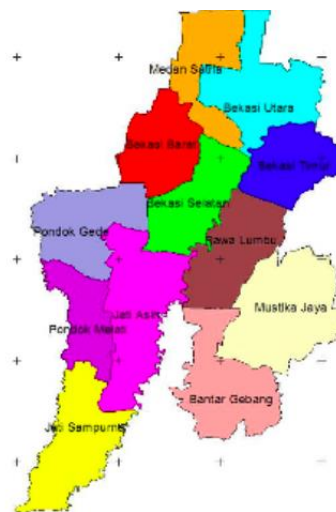
Peta Administrasi Kota Bekasi