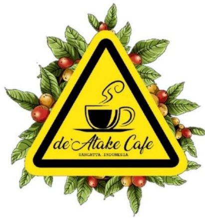
Gambar 2. 1 Logo Atake Coffee

Desain logo pada perusahaan merupakan hal yang penting karena dapat berpengaruh terhadap minat dan kepekaan konsumen terhadap suatu usaha bisnis, logo pada perusahaan memiliki arti tersendiri bagi perusahaan. Berikut logo dari Atake Coffee