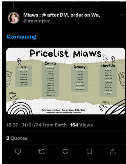
Gambar 1. Contoh Postingan Penjual