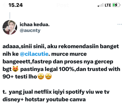
Gambar 5. Contoh Kalimat Penawaran akun Canva oleh Penjual di media sosial X