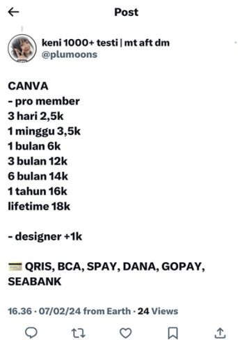
Gambar 2. Contoh Variasi Produk yang ditawarkan