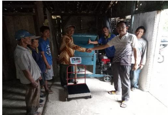
Gambar 2. Penyerahan bantuan mesin Gin-Chop dan Timbangan Digital oleh Ketua Tim

Seperti diketahui bahwa pakan merupakan faktor terbesar yang mempengaruhi produksi susu sapi perah, oleh karena itu dalam kegiatan pengabdian kepada masyarakat skim UFST2D ini telah dilatih praktek pembuatan ransum sapi perah, sehingga diperlukan fasilitas mesin pengolah pakan antara lain berupa mesin Grin-Chop dan timbangan digital. Mesin Grin-Chop (gambar 2) tersebut dapat berfungsi ganda yaitu dapat mencacah rumput dan juga dapat berfungsi sebagai penggiling bahan pakan konsentrat, antara lain: jagung, tongkol jagung, onggok, bungkil kopra, bungkil kapuk, dan bahan pakan kasar lainnya. Dokumentasi penyerahan bantuan mesin Gin-Chop dan Timbangan Digital disajikan pada gambar 2.