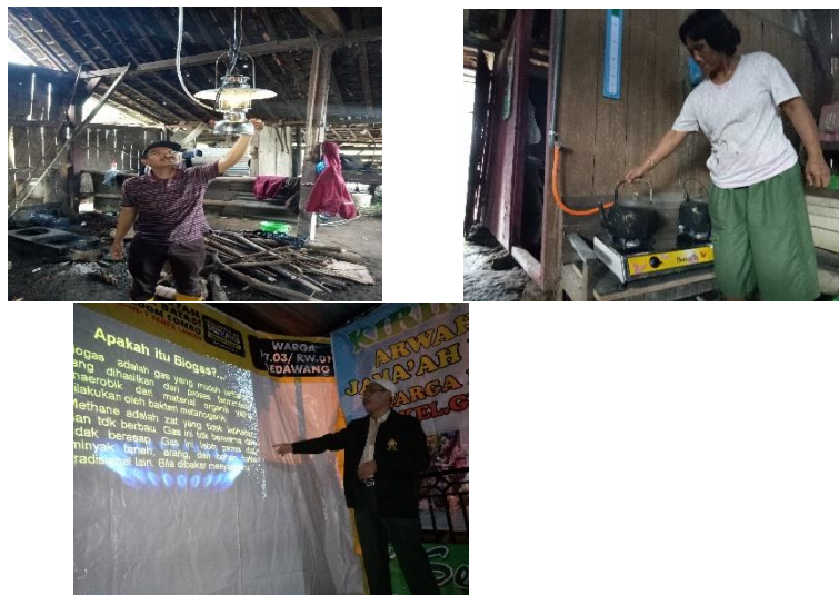
Gambar 3. Penyuluhan dan Instalasi Biogas pada Kegiatan II

Selain seperangkat mesin pengolah pakan, juga diberikan bantuan unit digester biogas dengan kapasitas 12 m 3 dilengkapi dengan kompor pemasak dan lampu biogas (gambar 3). Biogas ini dibangun sebagai upaya untuk mengatasi permasalahan limbah feces ternak sapi perah yang sebelum ada kegiatan UFST2D telah mengganggu lingkungan sekitar karena bau feces ternak sapi yang tercecer di luar kandang.