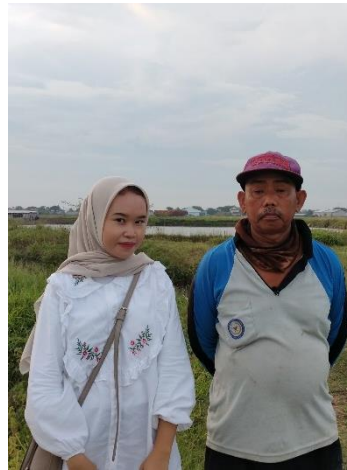
Wawancara dengan penggarap tambak garam