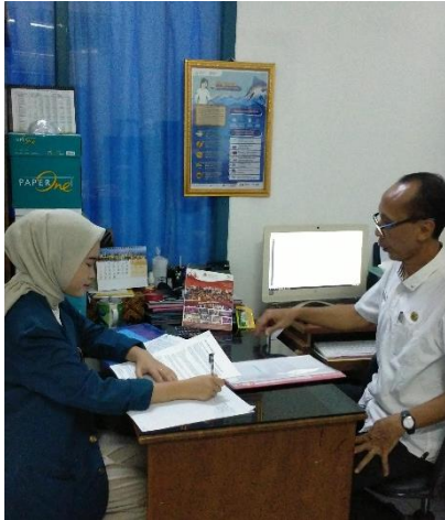
Wawancara dengan Kepala Seksi Pemberdayaan Usaha Garam Rakyat DKP Kabupaten Pati