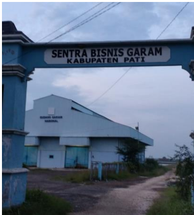
Gapura menuju GGN dan beberapa Lahan Tambak