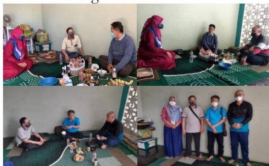
Gambar 5. Koordinasi dan Pendampingan Tim dengan UMKM Mitra

Sebagai bentuk implementasi kesepakatan yang sudah dikoordinasikan sebagai solusi untuk menyelesaikan masalah mitra, yaitu mendorong pengembangan usaha dan fasilitasi pengurusan paten merek Kopi Cap Lelet Cangkir ke Kemenkumham Republik Indonesia, status pengajuan paten merek sampai dengan tanggal 17 September 2021 dapat dilihat pada Gambar 5 di bawah. UU Nomor 20 Tahun 2016 Merek dan Indikasi Pasal 46 ayat (4) menyatakan bahwa untuk pemberdayaan UMKM, pemerintah dapat mendaftarkan merek kolektif yang diperuntukkan bagi pengembangan usaha dimaksud dan/atau pelayan publik. Jadi, jika merujuk pada Pasal 46 ayat (4) di atas, maka pemerintah sebenarnya memiliki kewajiban untuk memberikan fasilitas dan kemudahan bagi UMKM agar memiliki paten merek.