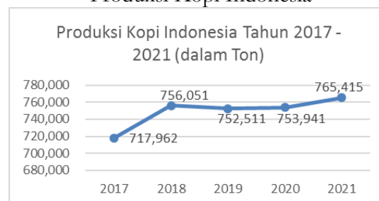
Gambar 1. Produksi Kopi Indonesia