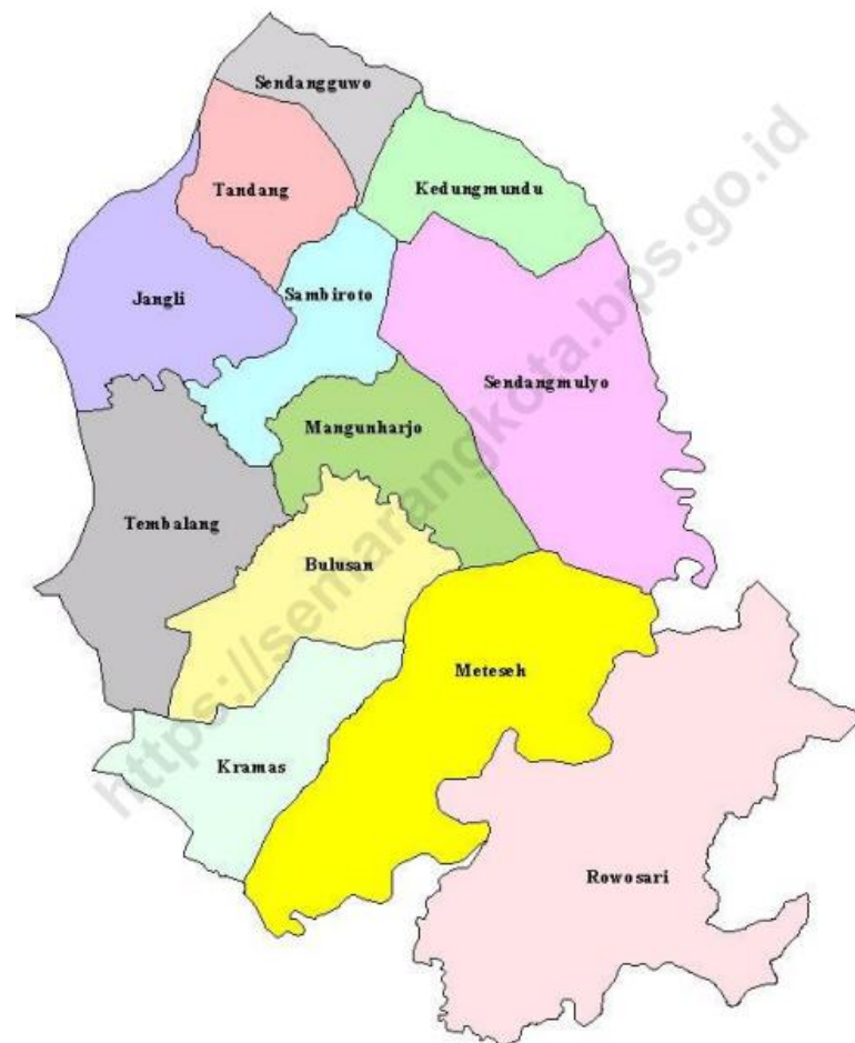
Gambar 2.3 Peta Wilayah Kecamatan Tembalang