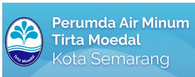
Gambar 2.4 Logo PDAM Kota Semarang