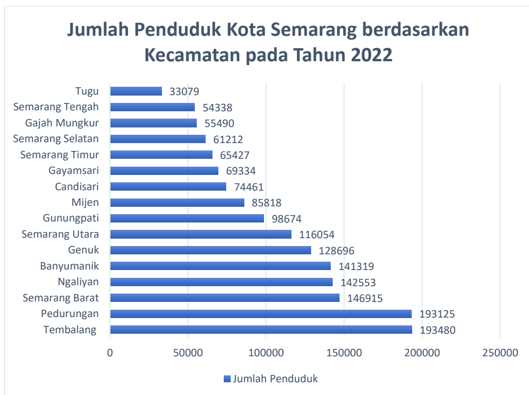
Gambar 2.2 Jumlah Penduduk Kota Semarang berdasarkan Kecamatan