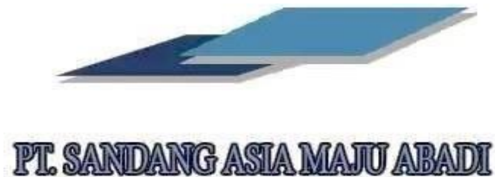
Gambar 2.1 Logo PT Sandang Asia Maju Abadi

Salah satu identitas khas sebuah entitas yang dapat mencerminkan pelayan dan produknya yaitu dengan adanya logo. Logo merupakan suatu bentuk gambar yang ditandai oleh konsumen seperti merek dagang, simbol grafis, dan nama perusahaan. Kehadiran logo tidak hanya mempermudah khalayak umum dalam mengenali konsep dan nilai suatu produk atau perusahaan, tetapi juga berfungsi sebagai langkah preventif untuk mencegah penyalahgunaan identitas perusahaan. Oleh karena itu, perusahaan memerlukan logo sebagai lambang identitas resmi formal. Logo dari entitas ini bisa dicerminkan di bawah ini: