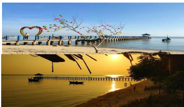
Gambar 2.3 Objek Wisata Pantai Pasir Putih

Pantai Pasir Putih mempunyai Visi Terwujudnya sapta pesona dalam kehidupan masyarakat Tasikharjo yang aktif dan mandiri. Untuk menunjang visi tersebut Pantai Pasir Putih mempunyai misi meningkatkan sumber daya manusia yang partisipatif dalam kegiatan intern maupun ekstern, mewujudkan lingkungan masyarakat yang aman, nyaman, indah, tertib dan bersih, mengembangkan daya tarik (potensi desa) dalam berbagai bidang, meningkatkan peranan generasi muda dalam pembangunan desa. pemberdayaan masyarakat yang berwawasan pariwisata, dan membangun insan yang terampil berwiraswasta. Berikut gambar Pantai Pasir Putih.