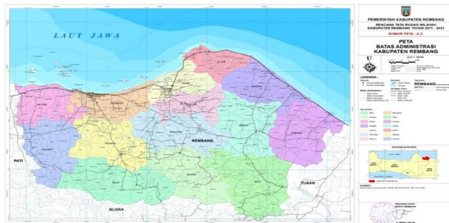
Gambar 2.1 Peta Administrasi Kabupaten Rembang