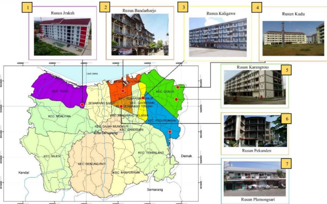
Gambar 2.3 Lokasi Rusunawa Kota Semarang