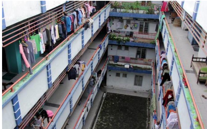
Gambar 2.4 Rusunawa Kaligawe Kota Semarang

terdapat juga penyalahgunaan penggunaan rusunawa di wilayah studi yang tidak hanya ditinggali oleh kaum tersebut, tetapi juga para pemangku kepentingan yang menggunakannya sebagai kontrakan maupun rumah sewa.