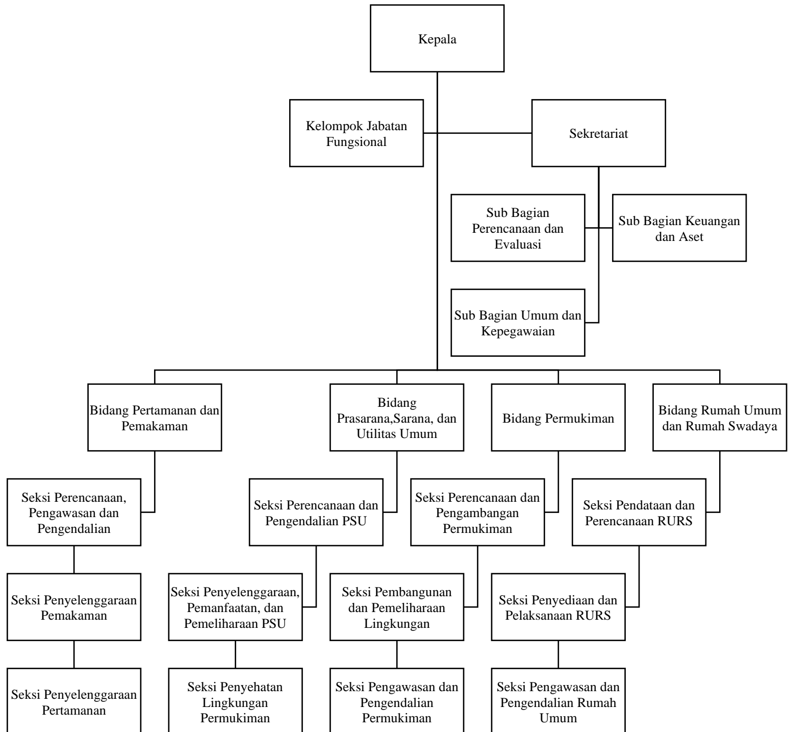
Gambar 2.2 Struktur Organisasi Dinas Perumahan dan Permukiman Kota Semarang