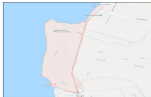
Gambar 1. Peta Wilayah Studi MSTP Teluk Awur Jepara (Google, n.d)

Pantai teluk awur merupakan salah satu pantai yang posisinya berada di pesisir kabupaten jepara jawa tengah. Pantai yang berada tepatnya di desa teluk awur kecamatan tahunan.