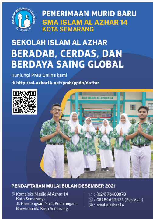
Gambar 2.1 Poster promosi SMA Islam Al Azhar 14

Pada upaya sekolah untuk meningkatkan kemampuan murid di bidang akademis, sekolah mengembangkan berbagai program seperti pemetaan minat dan bakat, klinik belajar, sinau bareng , sukses SBMPTN, career expo , dan edu expo . Pada bidang lainnya atau nonakademis, sekolah menyediakan berbagai kegiatan pengembangan diri seperti latihan kepemimpinan, character building , dan social live in yang dilakukan dengan tujuan untuk membentuk karakter leadership yang tangguh dan juga peduli, hingga festival riset untuk membangun paradigma ilmiah, serta festival film dan pentas seni untuk mendukung kreativitas murid.