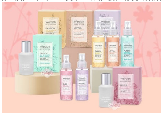
Gambar 2. 19 Produk Wardah Scentsation

Body Mist Joyful, Body Mist Passion, Body Mist Bliss, Body Mist Peaceful, Body Mist Purity, Eau De Toilette Purity, Eau De Toilette Passion, Eau De Toilette Bliss, Eau De Toilette Joyful, Eau De Toilette Peaceful.