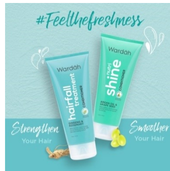
Gambar 2. 22 Produk Wardah Conditioner