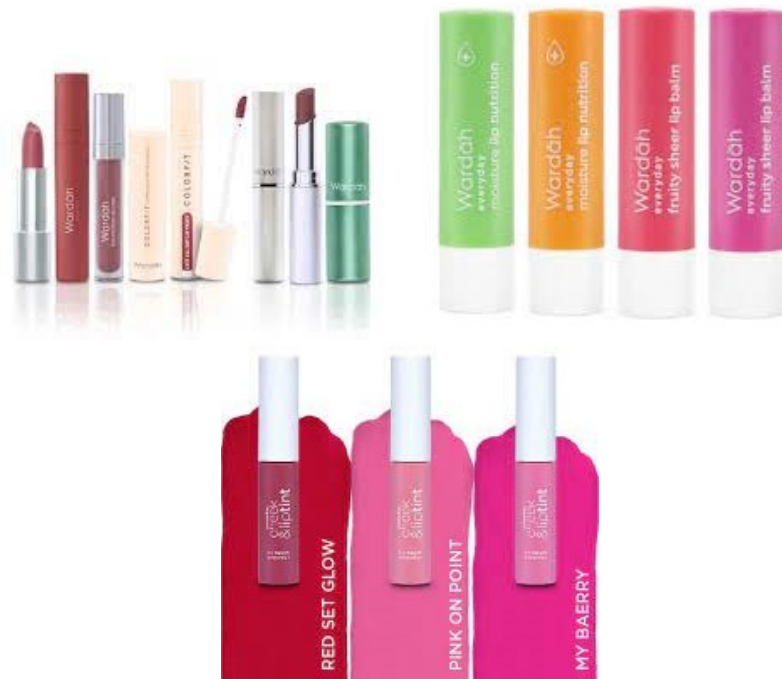
Gambar 2. 16 Produk Wardah Lips