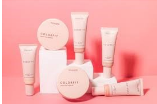
Gambar 2. 13 Produk Wardah Colorfit