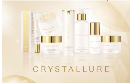
Gambar 2. 5 Produk Wardah Crystallure

Crystallure Supreme Activating Booster Essence, Crystallure Supreme Double Action Micellar Gel, Crystallure Supreme Advanced Eye Serum, Crystallure Supreme Revitalizing Rich Cream, Crystallure Supreme Revitalizing Oil Serum, Crystallure Supreme Advanced Hydra Gel, Crystallure Supreme Activating Overnight Cream.