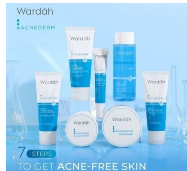
Gambar 2. 12 Produk Wardah Acnederm

Acnederm Acne Care Serum, Acnederm Acne Sport Treatment Gel, Acnederm Night Treatment Moisturizer, Acnederm Day Moisturizer, Acnederm Pure Refining Toner, Acnederm Pure Foaming Cleanser, Acnederm Pore Blackhead Balm.