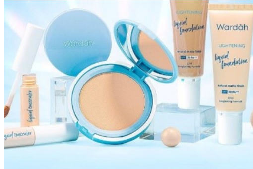
Gambar 2. 15 Produk Wardah Face