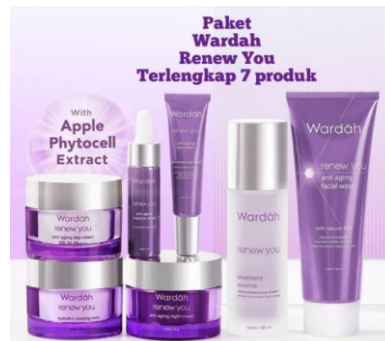
Gambar 2. 10 Produk Wardah Renew You

Renew You Day Cream, Renew You Toner Essence, Renew You Anti Aging Hydrat Firm Sleeping Mask, Renew You Anti Aging Eye Cream, Renew You Anti Aging Intensive Serum, Renew You Anti Aging Night Cream, Renew You Anti Aging Facial Wash.