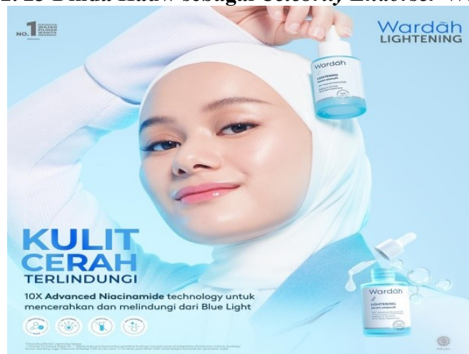
Gambar 2. 23 Dinda Hauw sebagai Celebrity Endorser Wardah