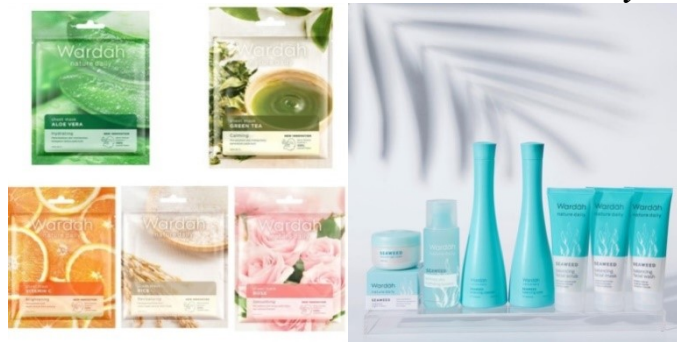
Gambar 2. 6 Produk Wardah Nature Daily

Seaweed Cleansing Micellar Water, Cleanser Nature Daily Seaweed Balancing Cleanser, Toner Nature Daily Seaweed Balancing Toner, Facial Mask Nature Daily Balancing facial mask , Face Scrub Nature Daily Seaweed Balancing facial scrub, Facial Wash Nature Daily Seaweed Balancing facial wash.