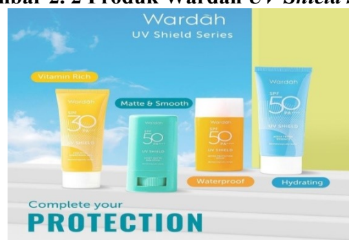
Gambar 2. 2 Produk Wardah UV Shield Series

UV Shield Light Matte Sun Stick SPF 50 PA++++, UV Shield Active Protection Serum 50 PA++++, UV Shield Aqua Fresh Essence SPF 50 PA++++, UV Shield Essential Sunscreen Gel SPF 30 PA+++.