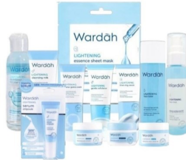
Gambar 2. 7 Produk Wardah Lightening