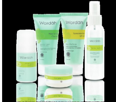
Gambar 2. 18 Produk Wardah Hajj & Umroh

Sunscreen Gel SPF 26, Moist Plus, Deo Roll On Anti Perspirant, Head to Toe Cleanser.