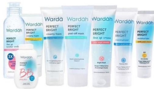
Gambar 2. 8 Produk Wardah Perfect Bright

Perfect Bright Micellar Water, Perfect Bright Tone Up Cream, Perfect Bright Peel Off Mask, Perfect Bright Moisturizer SPF 28, Perfect Bright Moisturizer Normal Skin, Perfect Bright Creamy Foam Brightening + Oil Control, Perfect Bright Creamy Foam Brightening + Smoothing