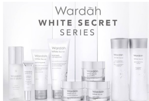
Gambar 2. 4 Produk Wardah White Secret

White Secret Pure Treatment Essence, White Secret Brightening Eye Cream, White Secret Exfoliating Scrub, White Secret Pure Brightening Cleanser, White Secret Facial Wash with AHA, White Secret Exfoliating Lotion, White Secret Day Cream, White Secret Night Cream, White Secret Intense Brightening Essence Serum, White Secret Hydraglow Sleeping Mask.