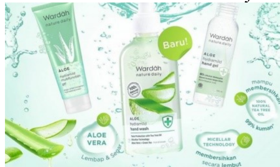
Gambar 2. 17 Produk Wardah Aloe Hydramild

Nature Daily Aloe Hydramild Body Wash, Nature Daily Aloe Hydramild Hand Wash, Nature Daily Aloe Hydramild Hand Gel, Nature Daily Aloe Hydramild Multifunction.