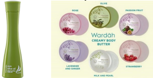
Gambar 2. 20 Body Butter

Creamy Body Butter Strawberry, Body Scrub Strawberry, Pure Olive Oil, Olive Oil fo Massage.