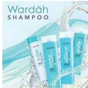
Gambar 2. 21 Produk Wardah Shampoo

Hairfall Treatment Shampoo, Anti Dandruff Shampoo, Nutri Shine Shampoo, Daily Fresh Shampoo.