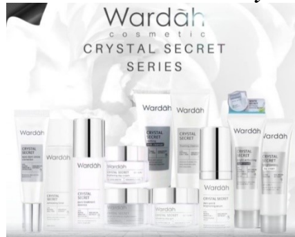
Gambar 2. 3 Produk Wardah Crystal Secret

Crystal Secret Dark Spot & Brightening Serum, Toner Crystal Secret Exfoliating Toner with Natural AHA & PHA.