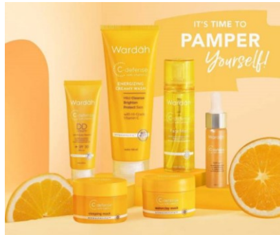
Gambar 2. 11 Produk Wardah C Defense