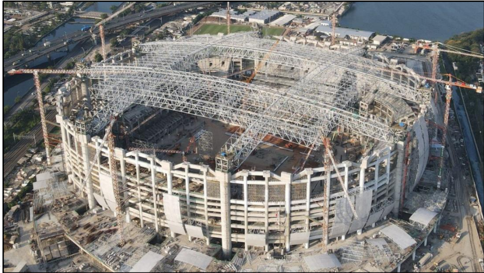
Gambar 2.3 Proses pembangunan JIS