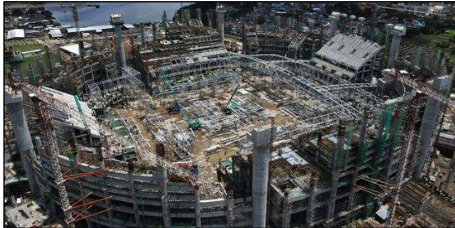
Gambar 2.2 Proses pembangunan Jakarta International Stadium

Pada akhir tahun 2000an hingga awal 2010an, rencana awal pembangunan untuk stadion baru Persija Jakarta akan dibangun sekitar 26.5 hektar di dekat Taman Bersih Manusia Berwibawa (BMW). Pada awalnya, stadion ini direncanakan untuk memiliki kapasitas sebanyak 50,000 penonton dan juga menambahkan track lari. Jakarta Internasional Stadium memiliki sejarah yang panjang sebelum akhirnya di resmikan pada bulan April 2022. Pembangunan stadion ini melibatkan empat kepemimpinan Gubernur DKI Jakarta yang berbeda. Stadion ini dimaksudkan untuk menjadi pengganti Stadium Lebak Bulus yang sudah digusur untuk dijadikan Stasiun MRT Jakarta.