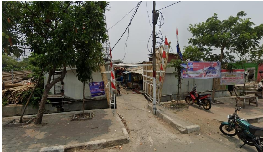
Gambar 2.5 Potret Kampung Bayam, Oktober 2018

Kampung Bayam juga mengalami pergeseran ke arah urbanisasi. Kawasan ini menghadapi berbagai tantangan dalam mengatasi masalah dari pembangunan nasional pada lingkungan kehidupan yang warga dihuni warganya.