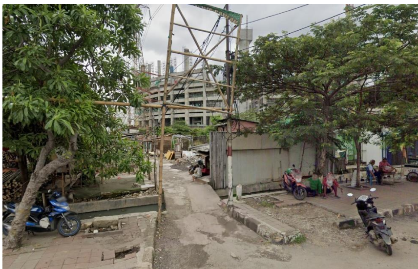
Gambar 2.6 Potret Kampung Bayam saat Pembangunan JIS berlangsung, Februari 2021