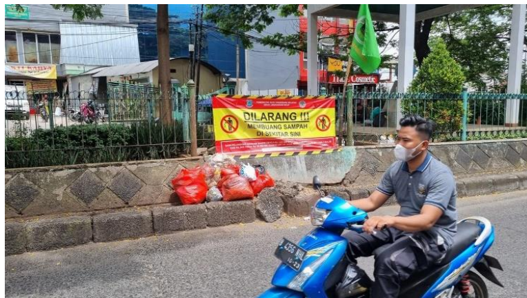
Gambar 1. 1 Sampah yang dibuang di Depan Tanda Larangan Membuang Sampah di Kawasan Pasar Ciputat

Pasar Ciputat, yang menjadi lokus dalam penelitian ini merupakan salah satu pasar tradisional terbesar di Kota Tangerang Selatan. Pasar ini dibuka sejak tahun 1980an hingga sekarang. Lokasinya yang dilewati jalan raya penghubung antara Jakarta-Bogor membuat pasar ini dapat dikatakan strategis dan selalu ramai akan transaksi jual-beli kebutuhan masyarakat. Saat ini melihat kondisi Pasar Ciputat masih kurang nyaman untuk melakukan transaksi jual-beli karena masih adanya sampah yang menumpuk di lingkungan pasar.