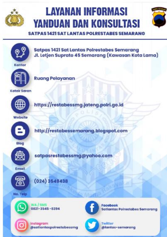
Gambar 2.6

1421 Sat Lantas Polrestabes memberikan kemudahan pelayanan dengan menyediakan akses media informasi, pengaduan dan konsultasi. Masyarakat dapat secara langsung meminta informasi tentang seputar penerbitan SIM.