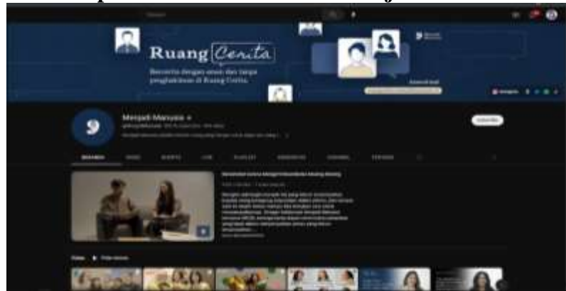
Gambar 2.1 Tampilan Channel Youtube "Menjadi Manusia"