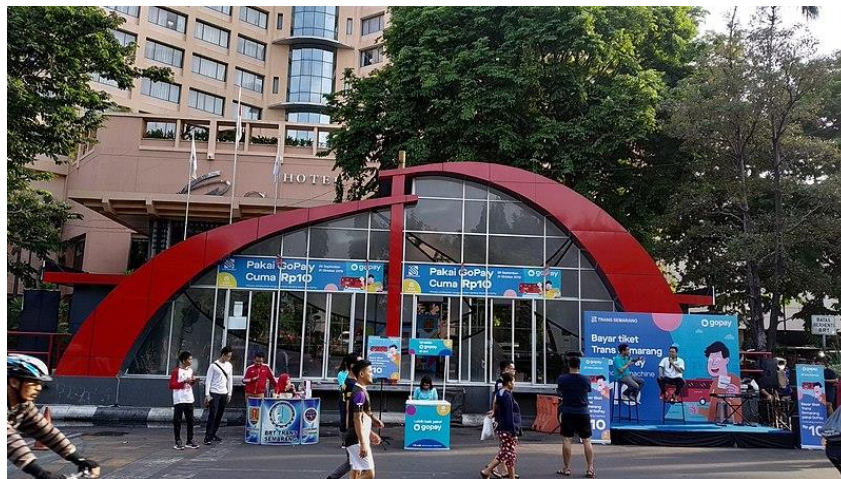
Gambar 2.5 Sampel Shelter Tipe A & Hebat