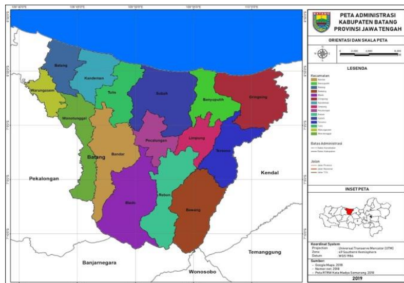
Gambar 2.1 Peta Wilayah Administratif Kabupaten Batang

Kabupaten Batang merupakan salah satu kabupaten yang terletak di Provinsi Jawa tengah. Wilayah administrasi Kabupaten Batang terdiri dari 15 kecamatan, 248 baik desa maupun kelurahan, 936 dusun, 3.680 RT dan 1.009 RW. Telah terjadi perkembangan jumlah wilayah administrasi kecamatan sejak berdirinya Kabupaten Batang, yang pada awalnya hanya terdiri dari 12 kecamatan, pada tahun 2007 dimekarkan menjadi 15 kecamatan. Luas wilayah Kabupaten Batang mencapai 78.864,16 Ha. Batas-batas wilayah Kabupaten Batang secara administratif adalah sebelah utara yaitu laut jawa; sebelah timur yaitu Kabupaten Kendal; sebelah selatan yaitu Kabupaten Wonosobo dan Banjarnegara; serta sebelah barat yaitu Kabupaten Pekalongan dan Kota Pekalongan.