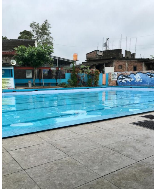
Gambar 2. 3 Kolam Renang Singampon

merupakan nama area kolam renang ini dibangun. Kolam renang Singampon memiliki sumber mata air sendiri sehingga kualitas air dapat terjaga.