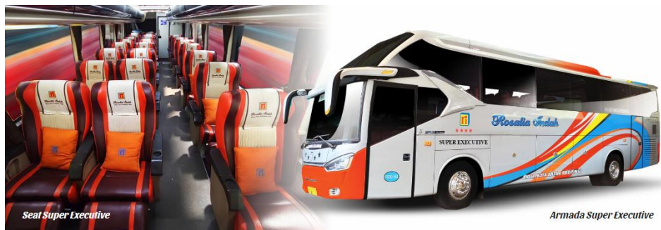
Gambar 2. 9 Seat Armada Super Executive

Terdapat fasilitas Reclining Seat dengan konfigurasi 1-2 (total berjumlah 23 seat) | Air Conditioner | LCD TV | Toilet | Selimut dan bantal | Foot rest | Leg rest | Layanan makan | snack | Free air mineral