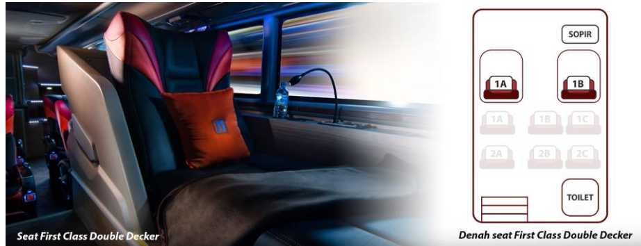
Gambar 2. 3 Seat Armada First Class Double Decker

Terdapat fasilitas Reclining Seat dengan konfigurasi 1-1 (total berjumlah 2 seat) | Air Conditioner | Kursi pijat | Toilet | LCD TV | Musik | Selimut, bantal, guling | Layanan makan Take Order | Snack | Free air mineral | Free Wifi | Layanan pramugara/i.