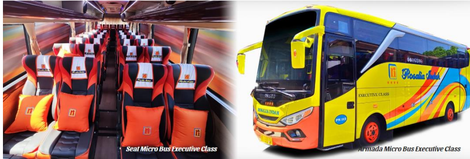
Gambar 2. 13 Seat Armada Micro Bus Executive Class

Terdapat fasilitas Reclining Seat dengan konfigurasi 2-2 (total berjumlah 29 seat) | Air Conditioner | LCD TV | Snack | Free air mineral