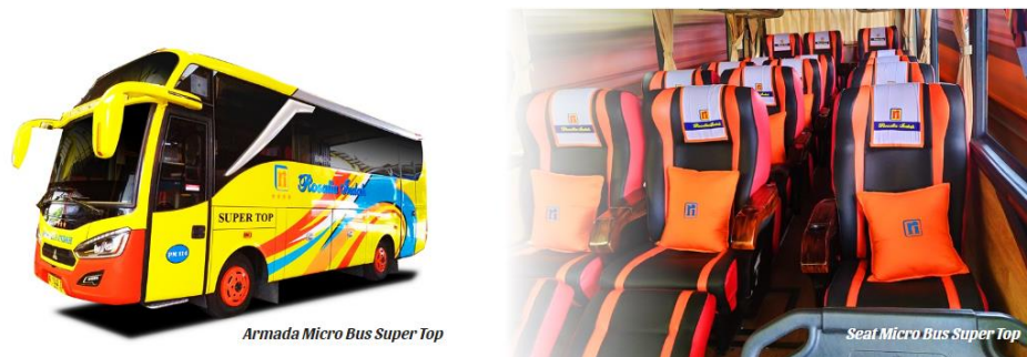
Gambar 2. 12 Seat Armada Micro Bus Super Top

Terdapat fasilitas Reclining Seat dengan konfigurasi 1-2 (total berjumlah 18 seat) | Air Conditioner | LCD TV | Snack | Free air mineral