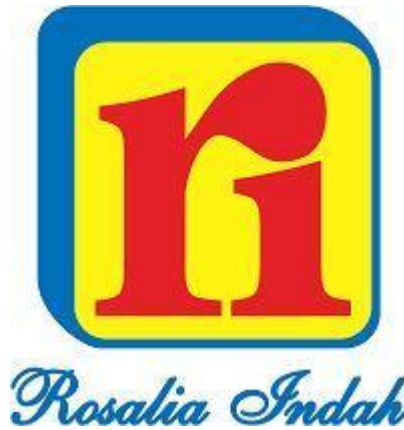
Gambar 2. 1 Logo PT Rosalia Indah Transport

diingat sebagai pengganti dari nama sebenarnya. Berikut ini terdapat logo PT Rosalia Indah Transport.