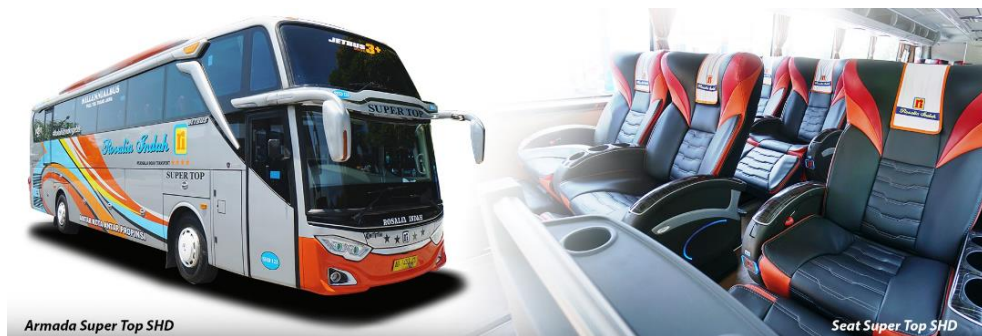
Gambar 2. 6 Seat Armada Super Top SHD

Terdapat fasilitas Reclining Seat dengan konfigurasi 2-1 (total berjumlah 21 seat) | Air Conditioner | LCD TV | Toilet | Selimut dan bantal | Foot rest | Leg rest | Layanan makan | snack | Free air mineral | Free wifi | Layanan pramugara/i.