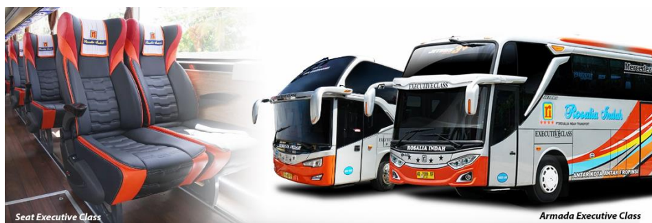
Gambar 2. 10 Seat Armada Executive Class

Terdapat fasilitas Reclining Seat dengan konfigurasi 2-2 (total berjumlah 36 seat) | Air Conditioner | LCD TV | Toilet | Selimut dan bantal | Foot rest | Layanan makan | Free air mineral