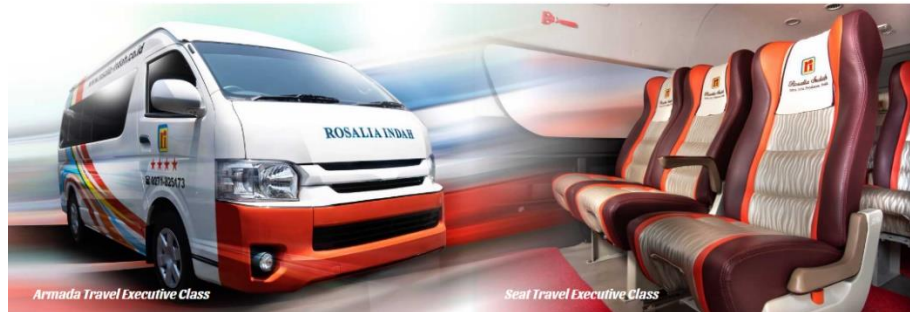
Gambar 2. 15 Seat Armada Travel Executive Class

Terdapat fasilitas Reclining Seat dengan konfigurasi 1-2 (total berjumlah 10 seat) | Air Conditioner | Snack | Free air mineral