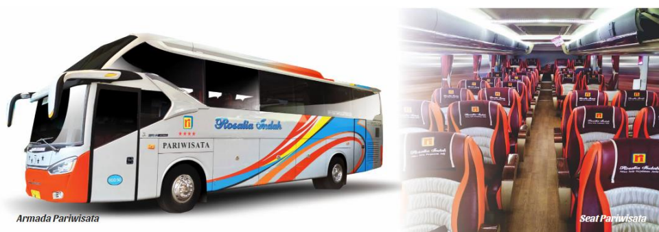
Gambar 2. 16 Seat Armada Pariwisata

Terdapat fasilitas Reclining Seat dengan konfigurasi 1-2 dan 2-2 (dan total berjumlah 18-50 seat/tergantung pemesanan) | Air Conditioner | LCD TV | Toilet/Non toilet | Foot rest/Leg rest