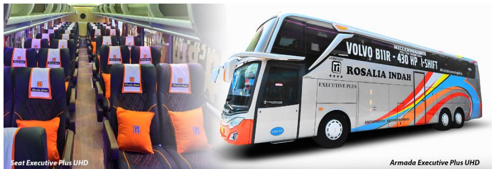
Gambar 2. 7 Seat Armada Executive Plus UHD

Terdapat fasilitas Reclining Seat dengan konfigurasi 2-2 (total berjumlah 38 seat) | Air Conditioner | LCD TV | Toilet | Selimut dan bantal | Foot rest | Leg rest | Layanan makan | snack | Free air mineral | Free wifi | Layanan pramugara/i. Namun, pada bus tipe UHD ini memiliki keunggulan pada bagasi bus yang tinggi dan luas sehingga bisa menampung barang bawaan yang jauh lebih banyak hingga sepeda motor sekalipun.