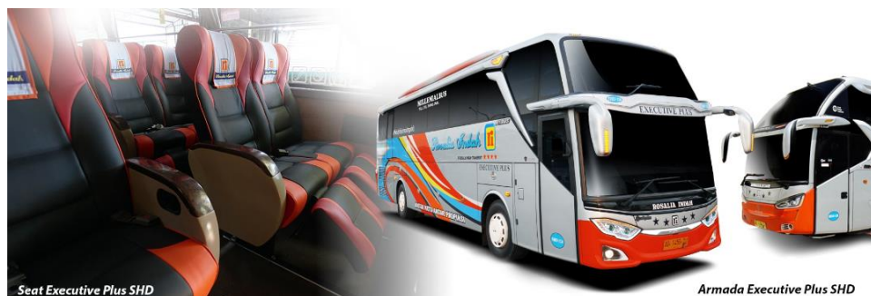
Gambar 2. 8 Seat Armada Executive Plus SHD

Terdapat fasilitas Reclining Seat dengan konfigurasi 2-2 (total berjumlah 34 seat) | Air Conditioner | LCD TV | Toilet | Selimut dan bantal | Foot rest | Leg rest | Layanan makan | snack | Free air mineral | Free wifi | Layanan pramugara/i.