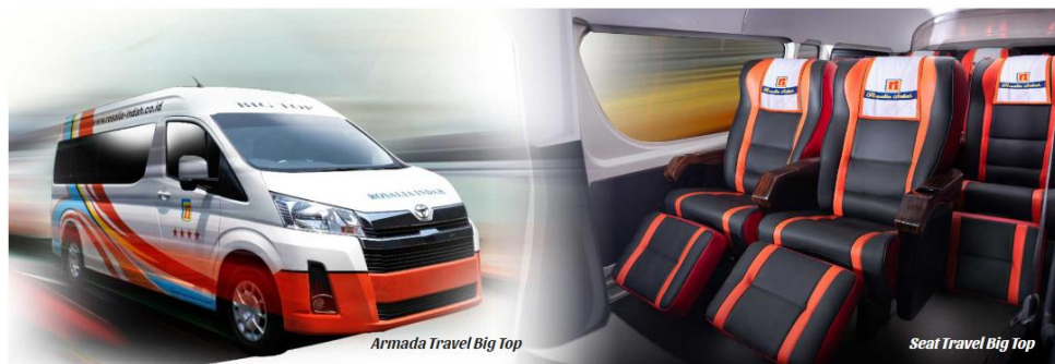
Gambar 2. 14 Seat Armada Travel Big Top

Terdapat fasilitas Reclining Seat dengan konfigurasi 1-1 (total berjumlah 8 seat) | AC | Snack | Free air mineral