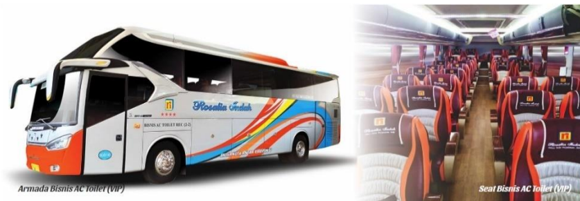
Gambar 2. 11 Seat Armada VIP

Terdapat fasilitas Reclining Seat dengan konfigurasi 2-2 (total berjumlah 40 seat) | Air Conditioner | LCD TV | Toilet | Selimut | Foot rest | Layanan makan | Free air mineral