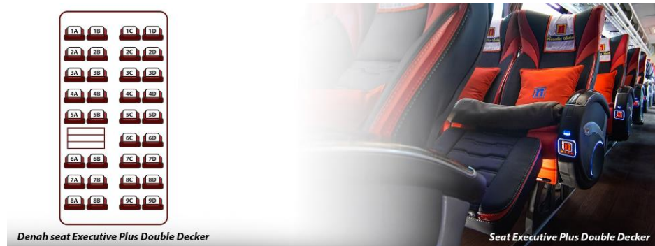
Gambar 2. 5 Seat Armada Executive Plus Double Decker

Terdapat fasilitas Reclining Seat dengan konfigurasi 2-2 (total berjumlah 34 seat) | Air Conditioner | LCD TV | Toilet | Selimut dan bantal | Foot rest | Leg rest | Layanan makan | snack | Free air mineral | Free wifi | Layanan pramugara/i.