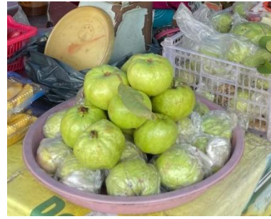
Produk jambu kristal Agrowisata Cepoko