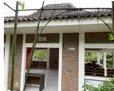
Joglo Agrowisata Cepoko