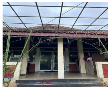
Kantor Kebun Cepoko