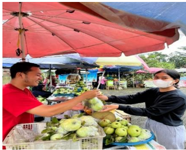
Pembeli secara tatap muka