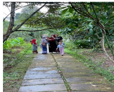
Pengunjung Kebun Cepoko