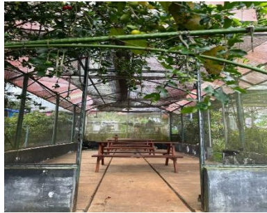
Tempat makan dan minum