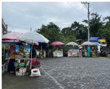
Stand tempat jualan petani