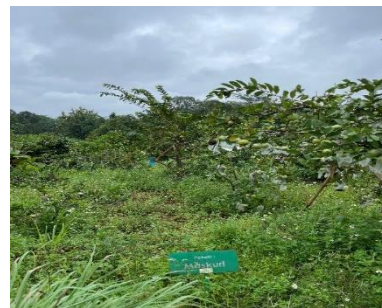
Lahan jambu kristal