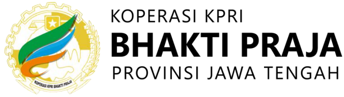
Gambar 2.1 Logo Koperasi Bhakti Praja Provinsi Jawa Tengah