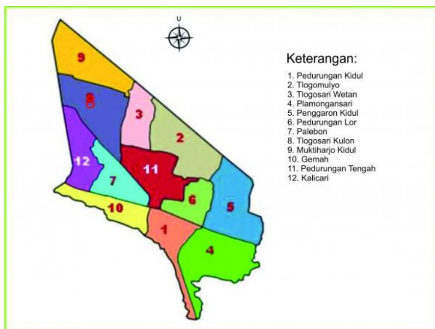
Peta Kecamatan Pedurungan