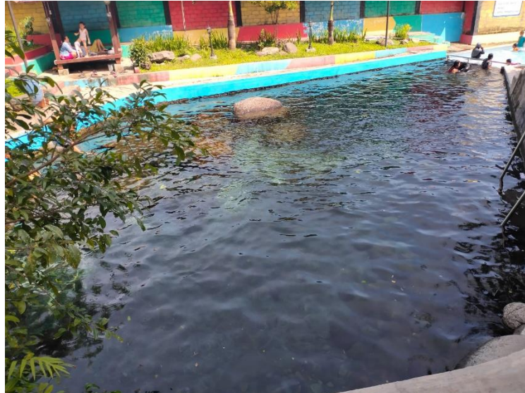
Gambar 2.7 Kolam Sumber atau Alami