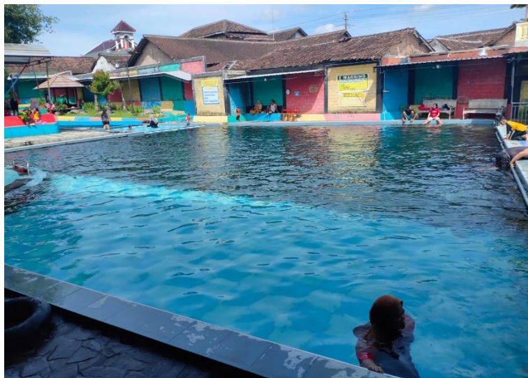
Gambar 2.5 Kolam Semua Umur