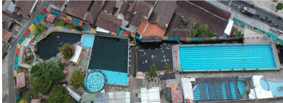
Gambar 2.3 Obyek Wisata Umbul Susuhan