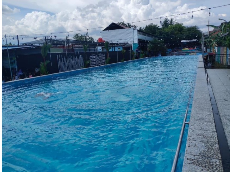
Gambar 2.8 Kolam Dewasa