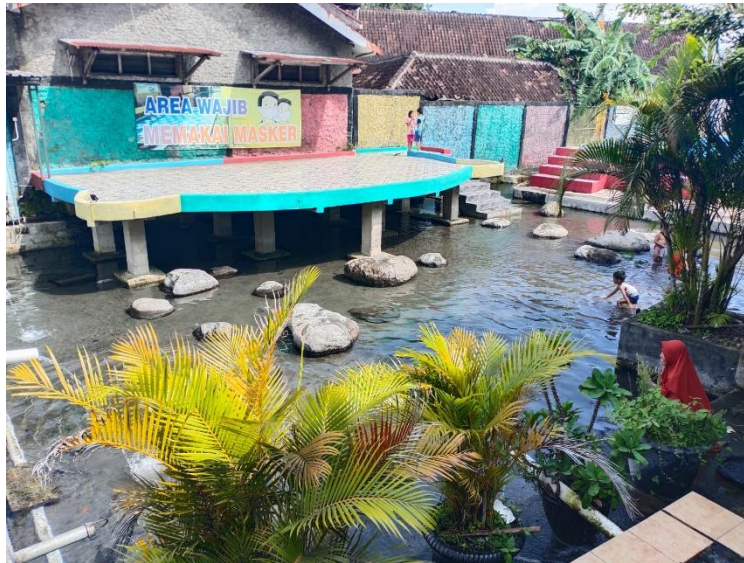
Gambar 2.6 Kolam Keceh