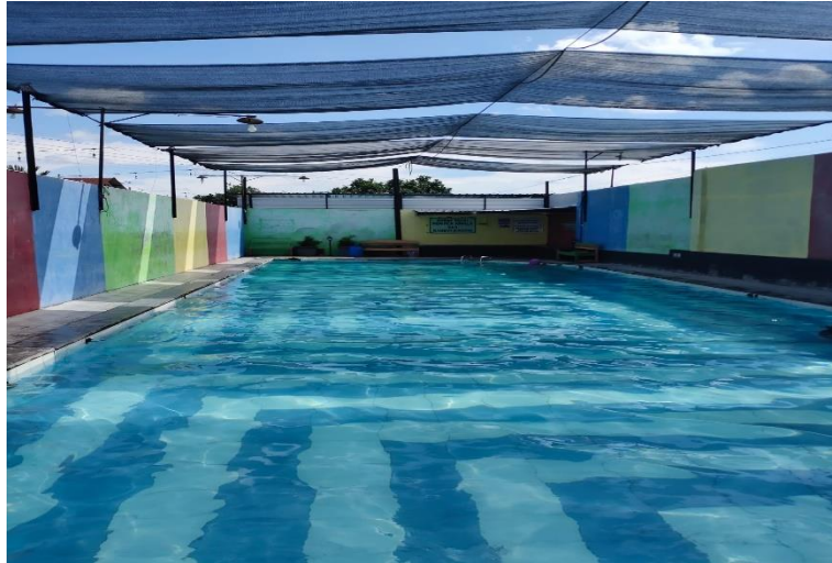
Gambar 2.4 Kolam Khusus Perempuan

pariwisata ditutup hingga waktu yang belum ditentukan. Hal ini karena masih terjadinya pandemi Covid-19 yang belum kunjung selesai hingga saat ini.