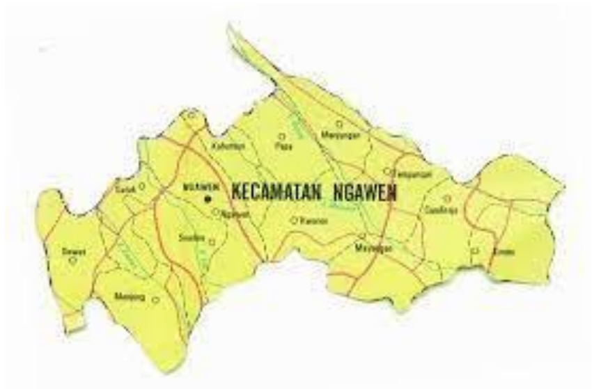
Gambar 2.2 Peta Kecamatan Ngawen

Kabupaten Klaten memiliki Kecamatan sejumlah dua puluh enam. Kecamatan Ngawen merupakan salah satu kecamatan yang ada di Kabupaten Klaten. Kecamatan Ngawen secara geografis terletak pada Bujur Timur: 110^{\circ} 30' - 110^{\circ} 45' dan Bujur Barat: 7^{\circ} 30' - 7^{\circ} 45' .