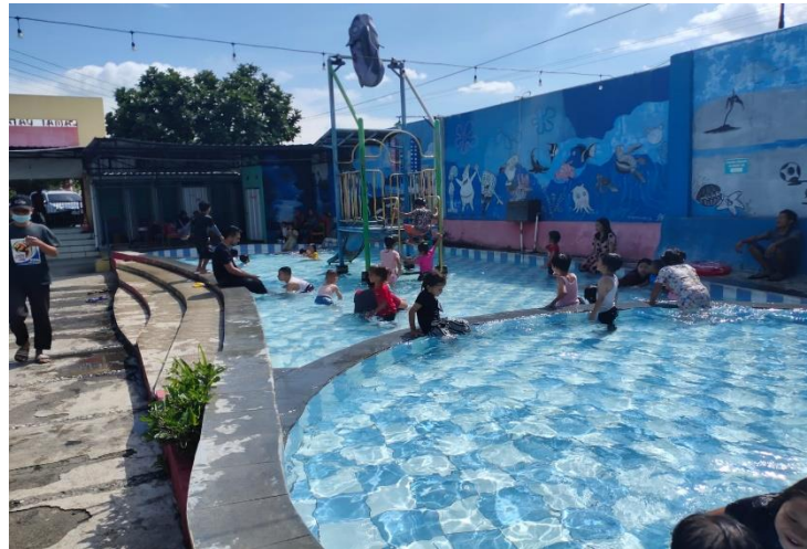
Gambar 2.9 Kolam Anak