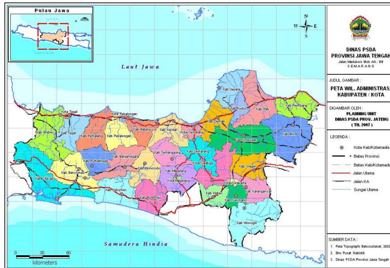
Gambar 2.1 Peta Wilayah Administrasi Provinsi Jawa Tengah