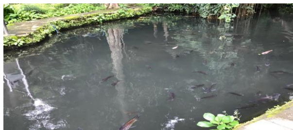
Gambar 2.1 Ikon Kampung Wisata Taman Lele

Kampung Wisata Taman Lele merupakan destinasi wisata berupa wisata alam dan taman hiburan yang menyajikan wahana darat maupun air dengan kolam lele sebagai ciri khas dari wisata ini. Pada Kampung Wisata Taman Lele menyediakan penginapan bagi wisatawan yang hendak berlibur dengan berbagai fasilitas yang disediakan.