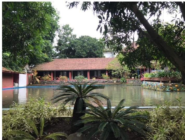
Gambar 2.2 Hotel Kampung Wisata Taman Lele