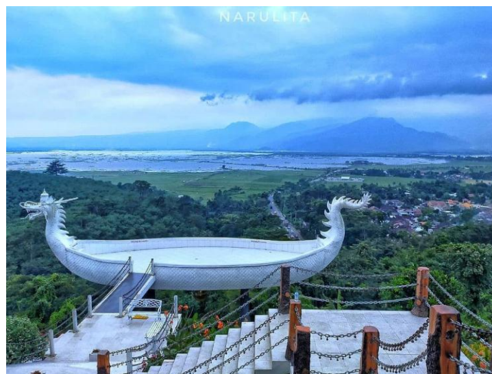
Gambar 2. 1

Wisata dengan keindahan alam dan fasilitas yang lengkap ini mempunyai akses masuk yang mudah dengan melewati kondisi jalan yang bagus. Untuk mencapai lokasi tersebut dapat menggunakan kendaraan roda dua maupun mobil. (jarak). Tiket masuk wisata Eling Bening pada hari biasa dikenakan tarif Rp 20.000,00 per orang, sedangkan untuk hari sabtu minggu dikenakan tarif Rp 25.000,00 per orang . Sebelum masuk dikenakan biaya 2000 rupiah untuk parkir kendaraan.