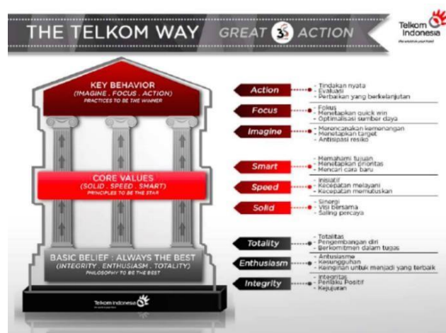
Gambar 2. 2 Nilai Organisasi PT Telkom

Seperti perusahaan lainnya, PT Telkom Indonesia juga memiliki nilai atau budaya perusahaan yaitu “The Telkom Way” yang digambarkan sebagai pilar.