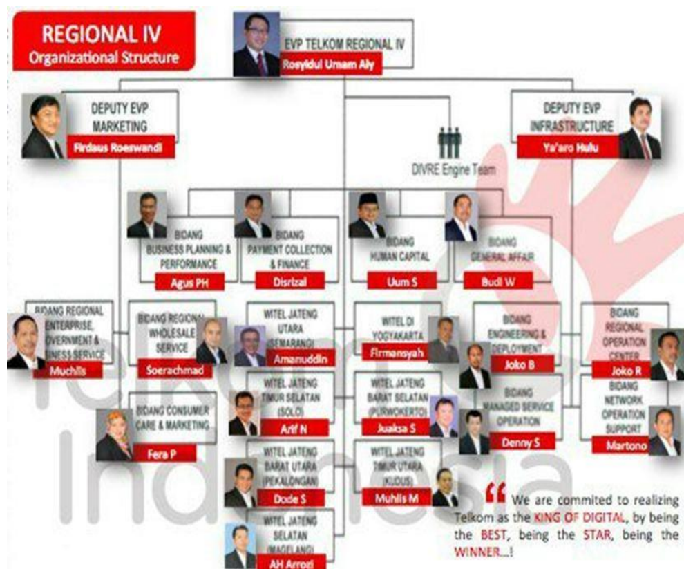
Gambar 2. 4 Struktur Organisasi Telkom Regional IV Jateng & DIY