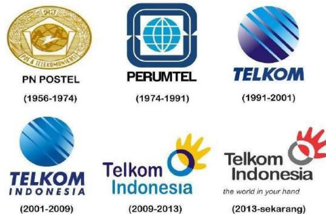
Gambar 2. 1 Transformasi Logo PT Telkom Indonesia (Persero) Tbk

pertama pada 1995 lalu, yang kemudian menjadi batu loncatan saham Telkom untuk memperjualbelikan sahamnya di bursa efek. Bukan hanya di Indonesia, melainkan saham Telkom juga dijual di bursa asing seperti New York dan London Stock Exchange.