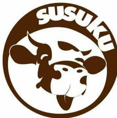
Gambar 2. 1 Logo Perusahaan

Suatu desain logo adalah perwakilan suatu perusahaan atau bisnis. logo adalah sebuah gambar, sketsa yang memiliki makna tertentu dan gambar tersebut mewakili arti dari suatu perusahaannya, karena suatu perusahaan memerlukan suatu hal yang mudah diingat dan singkat sebagai pengganti nama sebetulnya. Berikut ini terdapat logo Cafe Susuku.